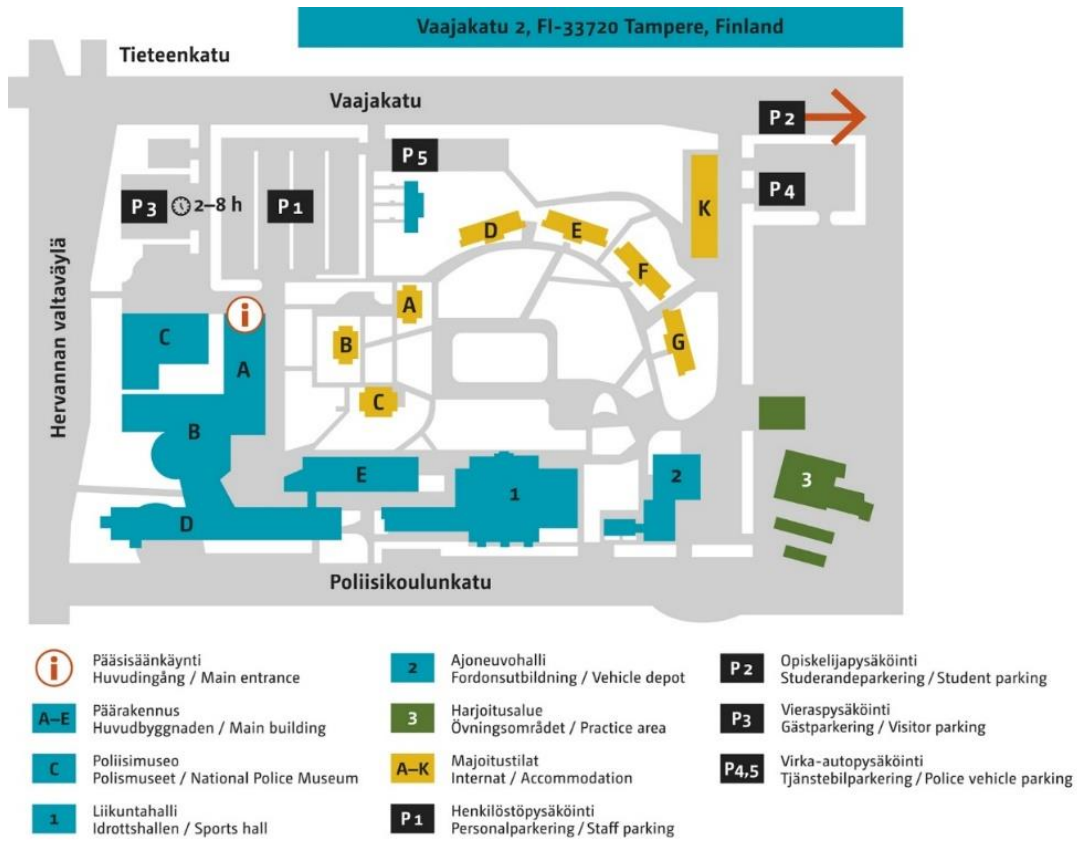
Kuva 4 Karttakuva Poliisiammattikorkeakoulun alueesta