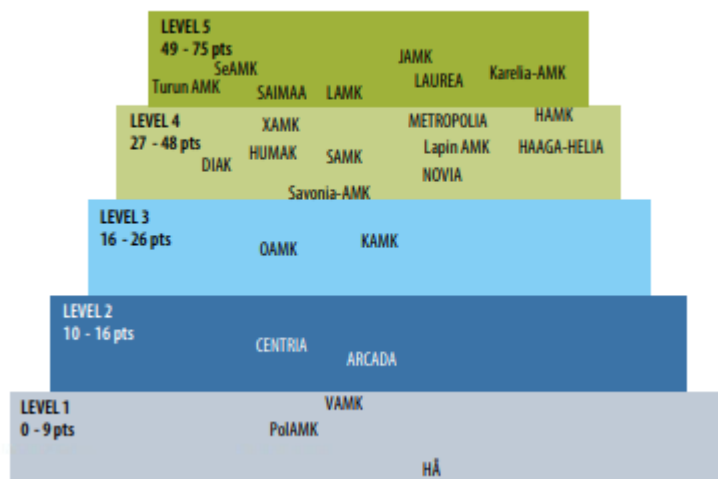
Kuva 1. Ammattikorkeakoulujen saamat pisteet avoimuutta kartoittavassa arvioinnissa vuonna 2019 7 .

Polamkin lisäksi arviointiasteikon alimmalle tasolle sijoittui kaksi muuta ammattikorkeakoulua. Asteikon ylimmälle eli tasolle 5 arvioitiin seitsemän ammattikorkeakoulua. Arvioinnissa oli mukana kaikkiaan 24 ammattikorkeakoulua. Kuvassa 1 on esitetty eri ammattikorkeakoulujen saamat pisteet arvioinnissa.