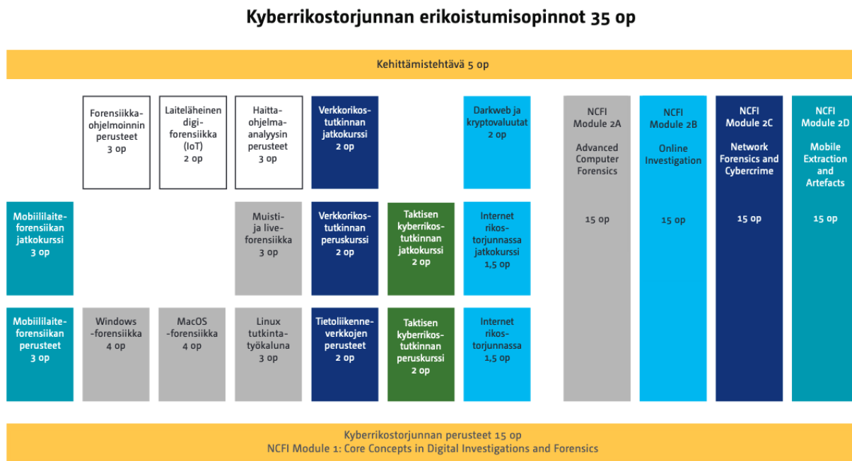
Kuva 2: Kyberrikostorjunnan erikoistumisopinnot (35 op)

Opintojaksojen opetusmateriaalit ovat osin englanninkielisiä. Joillakin opintojaksoilla opetus voidaan toteuttaa englanniksi.