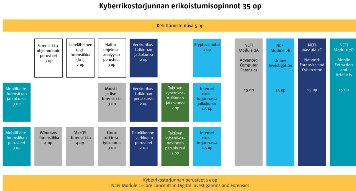
Kuva 2: Kyberrikostorjunnan erikoistumisopinnot (35 op)