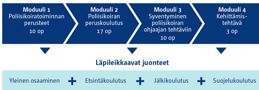
Kuva 1 Partiokoiranohjaajan erikoistumisopinnot (40 op).

Opintoihin sisältyy kehittämistehtävä, joka aloitetaan moduuli 2 aikana.