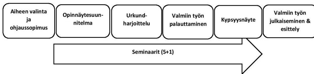
Kaavio 1. Opinnäytetyöprosessi YAMK-tutkinnossa.

Koska ajattelutyölle ja ideoinnille on hyödyllistä antaa mahdollisimman paljon aikaa, opinnäytetyöprosessi käynnistetään YAMK-opintojen alussa. Itseä kiinnostavia aiheita kannattaa alkaa pohdiskella ja kirjata ylös mahdollisimman nopeasti. Kaavioon 1 on karkeasti hahmoteltu opinnäytetyöprosessin eri vaiheita opiskelijan näkökulmasta.