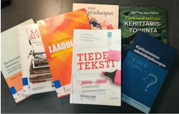
Kuva 2. Opinnäytetyön tekijän kannattaa hakea tukea kirjoittamista ja tutkimusta käsittelevästä kirjallisuudesta, jota Polamkin kirjastossa on hyvin tarjolla. (kuva: Anu Haikansalo)

Wordin yläpalkkiin ilmestyy valinta Muotoile. Sieltä valitaan kohta Vaihtoehtokuvaus . Kuvauksen on tarkoitus olla lyhyt kuvaus siitä, mitä kuvassa on, jotta myös sokeat tai huonosti näkevät henkilöt saavat informaation kuvan sisällöstä. Esimerkiksi kuvan 2 vaihtoehtokuvaus on seuraava: Seitsemän kirjaa ja niiden kannet lomittain. Kirjallisuus on kirjoittamista ja tutkimusta käsittelevää.