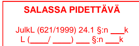
Kuva 4. Esimerkit leimoista, joilla salassa pidettävä versiot merkitään.

Arkistoitavaksi toimitettava salassa pidettävä osio tai työn versio merkitään määrämuotoisella leimalla (kuva 4), jonka saa muokkaamalla asiakirjaa Kameleonissa (ohje: Työkalurivin Muut toiminnot -kohdasta löytyy Salassapito ja sieltä löytyvät kaiken tasoiset leimat. Lisää oikeaan leimaan sopivat lainkohdat ja lisää työhösi. Leima tulee automaattisesti oikeaan paikkaan kansilehdelle.) Jos salassapitoa ja turvallisuusluokittelua koskeva merkintä perustuu (edes osittain) Poliisihallituksen asiakirjan omistajan määrittelemään rajoitukseen, asia pitäisi ilmetä selvästi opinnäytetyön tiivistelmästä. Asian voisi ilmaista esim. seuraavasti: Opinnäytetyön salassapito ja turvallisuusluokka perustuvat tutkimuslupapäätökseen xx.xx.20xx (POL-20xx-xxxxx) .