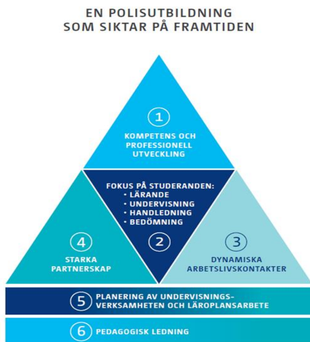
Figur 1: Den pedagogiska verksamhetens element vid Polisyркeshögskolan

Syftet med Polisyркeshögskolans pedagogiska riktlinjer är att säkerställa en gemensam uppfattning om undervisningen och lärandet, undervisningsverksamhet av hög kvalitet samt en välmående arbetsgemenskap. De pedagogiska riktlinjerna stöds av utbildningens planering, läroplansarbetet och den pedagogiska ledningen.