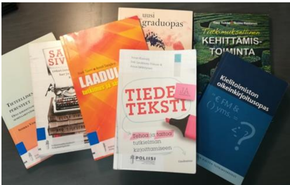
Kuva 1. Opinnäytetyön tekijän kannattaa hakea tukea kirjoittamista ja tutkimusta käsittelevästä kirjallisuudesta, jota Polamkin kirjastossa on hyvin tarjolla.

Saavutettavuuden toteutumisen kannalta on tärkeää, että kuville ja kuviksi muutetuilla taulukoille ja kuvioille kirjoitetaan vaihtoehtokuvaus. Se tapahtuu valitsemalla kuva hiirellä, jonka jälkeen Wordin yläpalkkiin ilmestyy valinta Muotoile. Sieltä valitaan kohta Vaihtoehtokuvaus . Kuvauksen on tarkoitus olla lyhyt kuvaus siitä, mitä kuvassa on, jotta myös sokeat tai huonosti näkevät henkilöt saavat informaation kuvan sisällöstä. Esimerkiksi kuvan 1 vaihtoehtokuvaus on seuraava: Seitsemän kirjaa ja niiden kannet lomittain. Kirjallisuus on kirjoittamista ja tutkimusta käsittelevää.